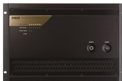
LED プロセッサ HLC-4K

地上デジタルテレビ放送の普及に伴いフル HD 映像が一般化した今、時代はさらなる高解像度化に向けて 4K/8K の世界へ動き始めました。LED ディ스플레이・システムは自発光素子の特徴を活かして高輝度・高精細の大画面を実現できる最高峰のディスプレイであり、LED 素子自体も照明用途としての爆発的な市場の拡がりと共に、急速に販売量を増やしております。